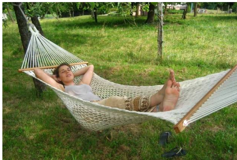
Position classique dans un hamac dit « rosette de lyon »