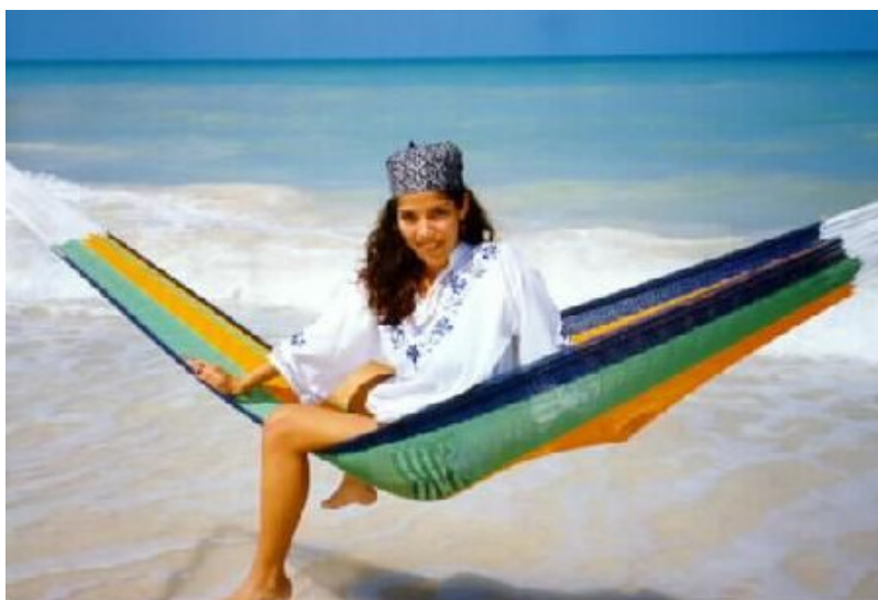
Position assise avec suspension aux nuages