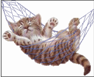
Le hamac pour chat